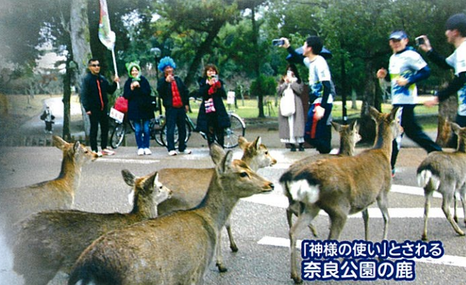
「神様の使い」とされる 奈良公園の鹿

募集期間 6月10日(水) ~ 8月21日(金) 事前説明会 11月7日(土) 奈良市役所内 11月14日(土) 天理市文化センター 参加必須