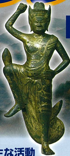
「山の神様」とされる 「蔵王権現立像」 奈良国立博物館所蔵

募集期間 6月10日(水) ~ 8月21日(金) 事前説明会 11月7日(土) 奈良市役所内 11月14日(土) 天理市文化センター 参加必須