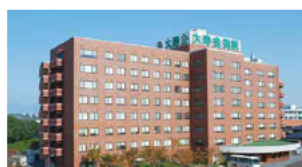
大寿会病院 [医療分野]